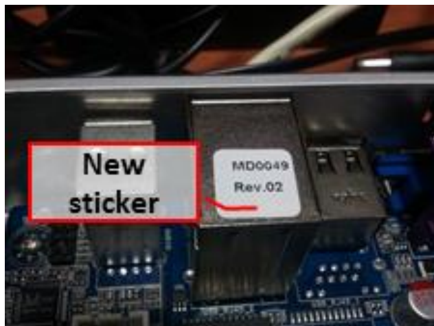
Gráfico 1: sticker del Motherboard Rev.02

La tarjeta de reseteo es pequeña y va conectada al panel frontal del motherboard (F_PANEL1). Aporta un patrón de encendido de la unidad que asegura que el motherboard se inicie correctamente luego de un breve corte de energía..